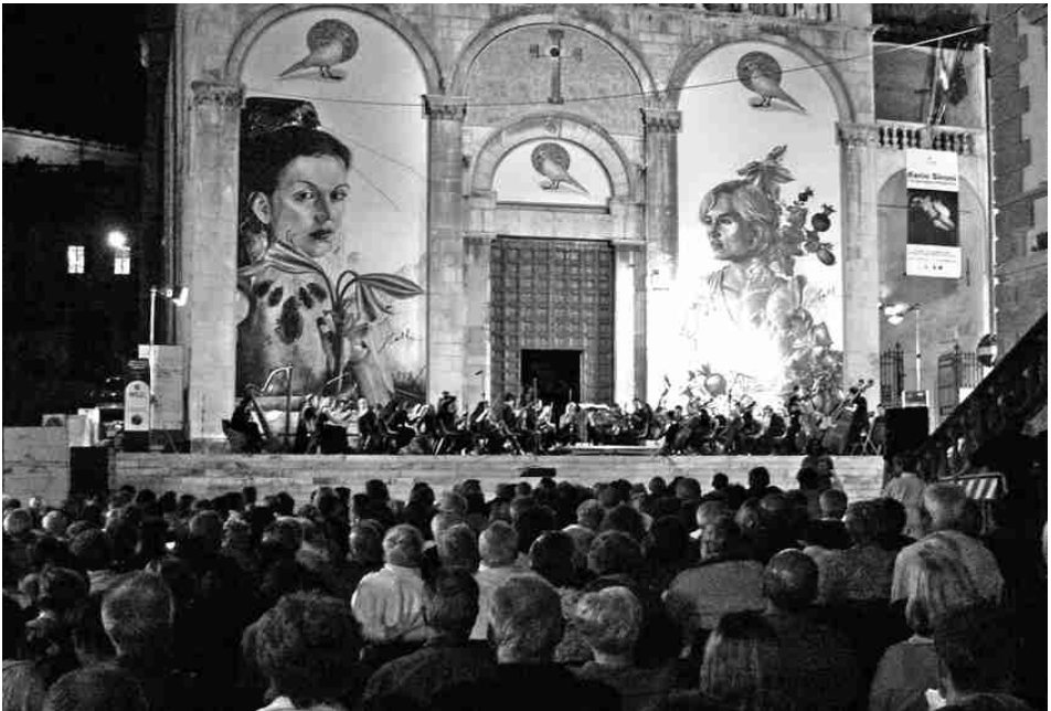
Pietrasanta - Concerto sul sagrato di Sant'Agostino