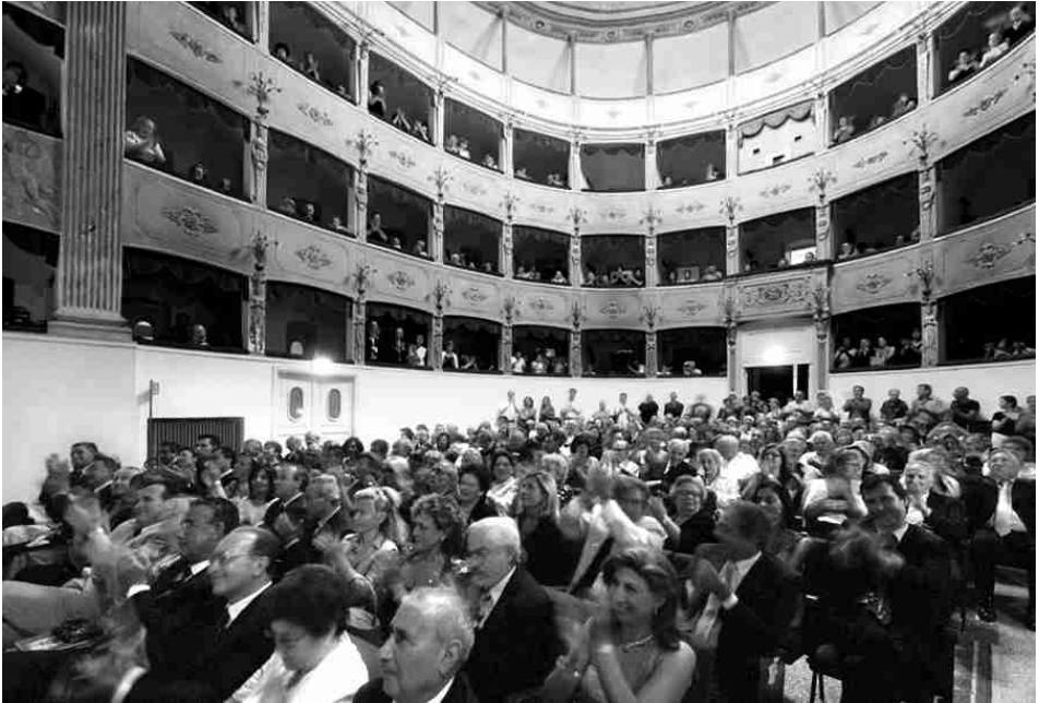
Sarzana - Teatro degli Impavidi - Serata finale 2006